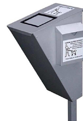
KP- kosz na psie odchody