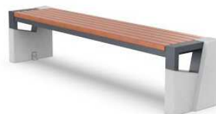
ŁG - ławka gospodarcza