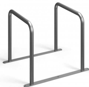
4 - stojak na rowery