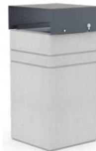
K - kosz na śmieci