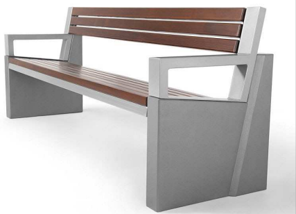
Ł - ławka